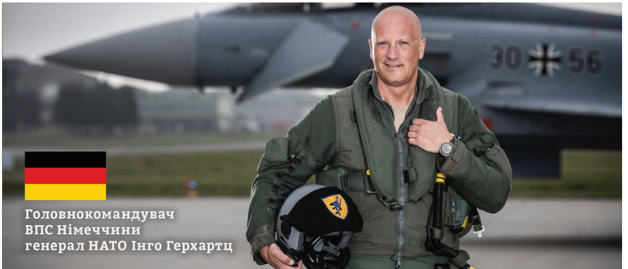
Головнокомандувач ВПС Німеччини генерал НАТО Інго Герхартц

Сухопутні війська країн Європи на території України можуть виконувати різні функції та завдання, тим самим не порушуючи норми міжнародного права. Приплив добровольців до Інтернаціонального легіону територіальної оборони України, який входить до складу Збройних сил України, також може проходити абсолютно легально. Безліч завдань, починаючи від гуманітарних, закінчуючи розмінуванням територій, можуть виконуватися солдатами армій європейських країн. Наприклад, уявімо собі, що іноземні контингенти військових можуть виконувати певні завдання із прикриття та охорони військових об'єктів в тилу. Це дало б змогу вивільнити наші окремі підрозділи та застосовувати їх для виконання завдань на інших напрямках.