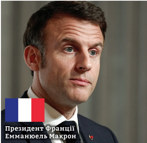
Президент Франції Емманюель Макрон

«Не виключено, що до України можуть бути направлені війська». Таку заяву зробив французький президент Емманюель Макрон під час зустрічі із лідерами близько 30 держав. Подія була присвячена необхідності нарощування підтримки України боеприпасами. Ба більше, французький лідер запропонував створити коаліцію далекобійної зброї. Мова саме про ракети. Водночас Макрон вжив досить цікаву фразу: «ракети, які можуть стратегічно змінювати ситуацію».