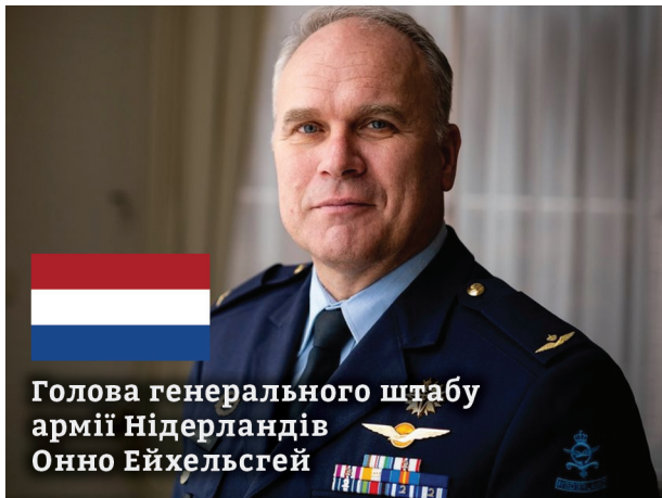
Голова генерального штабу армії Нідерландів Онно Ейхельсгей

Це змусило російських пропагандистів на своїх інформаційних «помийках» розповідати, як французи за це заплачуть і інші нісенітниця. А мова, нагадаю, про ядерну державу, велику європейську країну — Францію, якій погрожує росія. До речі путін думає, що він єдиний, хто намагається вправлятися в історизмі, маніпулюючи та спотворюючи історичні факти. Але в Європі вивчають історію набагато краще і дуже добре пам'ятають, що Франція та Британія зробили в 50-х роках XIX століття потопивши Чорноморський флот тодішньої російської імперії і вигравши битву за Севастополь.