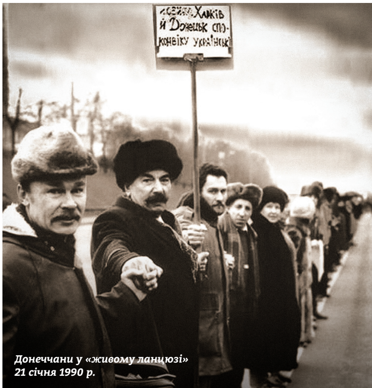
Донеччани у «живому ланцюзі» 21 січня 1990 р.

105 років тому — 22 січня 1919 року на Софійському майдані в Києві був проголошений Акт Злуки, який став епохальною історичною подією, коли українські землі об'єдналися в одній державі.