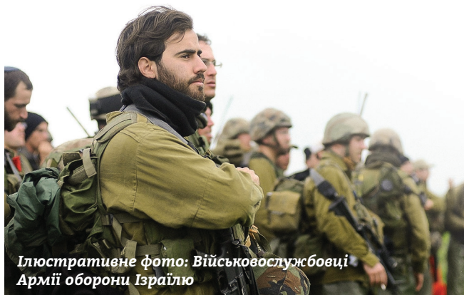
Ілюстраційне фото: Військовослужбовці Армії оборони Ізраїлю

Вже 75 років з дня створення держави в Ізраїлі діє режим надзвичайного стану. Це означає, що країна постійно готується до війни. Ця підготовка включає в тому числі і тренування, які мають зміцнити психіку військовослужбовців армії оборони Ізраїлю (АОІ) і не дати їм втрати контроль над собою на полі бою.