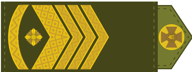
Головний майстер-сержант на посаді головного сержанта ЗСУ